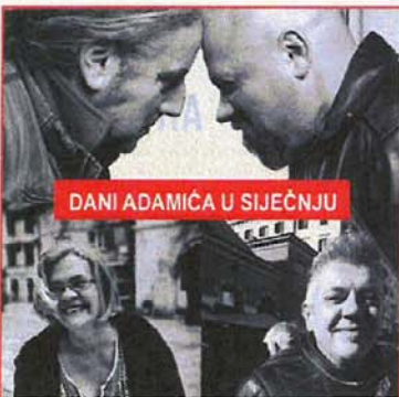
DANI ADAMIĆA U SIJEČNJU

UPRAVNI ODJEL ZA PROSTORNO UREĐENJE GRADA OPATIJE