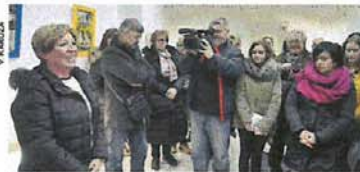
Publika na otvorenju izložbe »More i ja«

ćenička Draga, Trsat..... Tehnikom kolaža samih naplavina. Vlasta stvara prepoznatljive primorske motive: kućice, barke, brodove, delfine...., a kolorističkom pak upotrebom boja donosi mediteranski ugođaj prostora - stoji u najavi ove zanimljive matuljske izložbe. (A.K.I.)